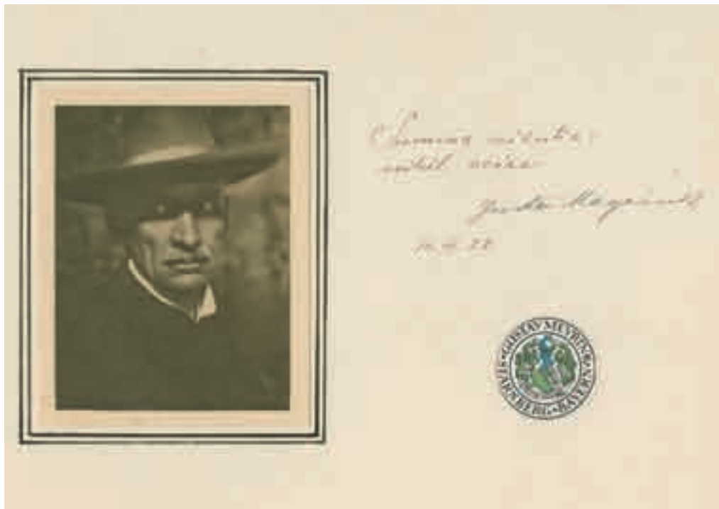
1. Gustav Meyrink, Albumblatt: „Summa scientia, nihil scire“ (siehe Seite 17)