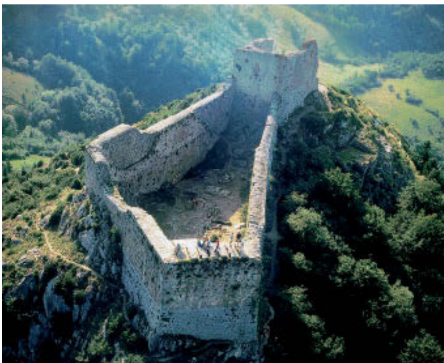
El castillo de 'Montségur'