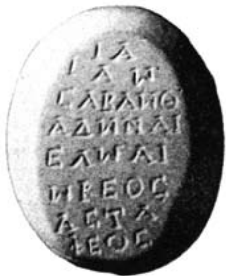
Gnostisch-magisch amulet met de namen van de boze planeetmachten, zie p. 259 en p. 465, aant. 284