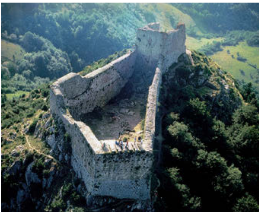
Het kasteel 'Montségur'